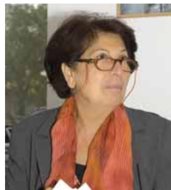
di CAROLINA TORTORELLA

Questi valori della confederalità hanno bisogno di una Cgil forte ed unita e di uno Spi sempre più rappresentativo.