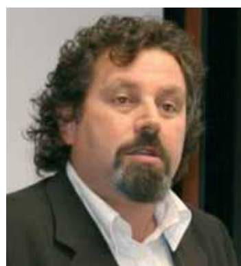
di PAOLINO BARBIERO