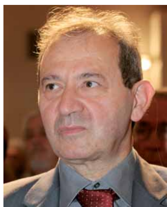
di LORENZO ZANATA