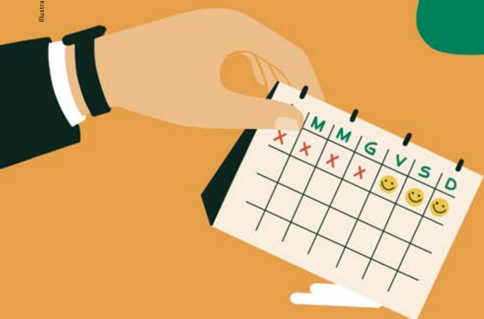
Illustrazione di Federica Centurelli

SOSTENIBILITÀ E LAVORO IMPRESCINDIBILE SINERGIA